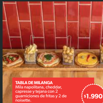
TABLA DE MILANGA

Mila napolitana, cheddar, capresse y tejana con 2 guarniciones de fritas y 2 de noisette.